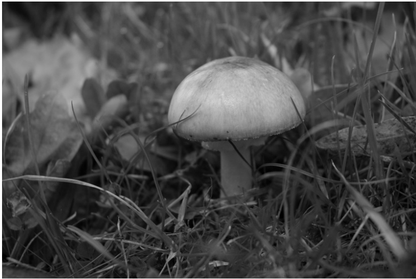
Groene knolamaniet. Zeer giftig!